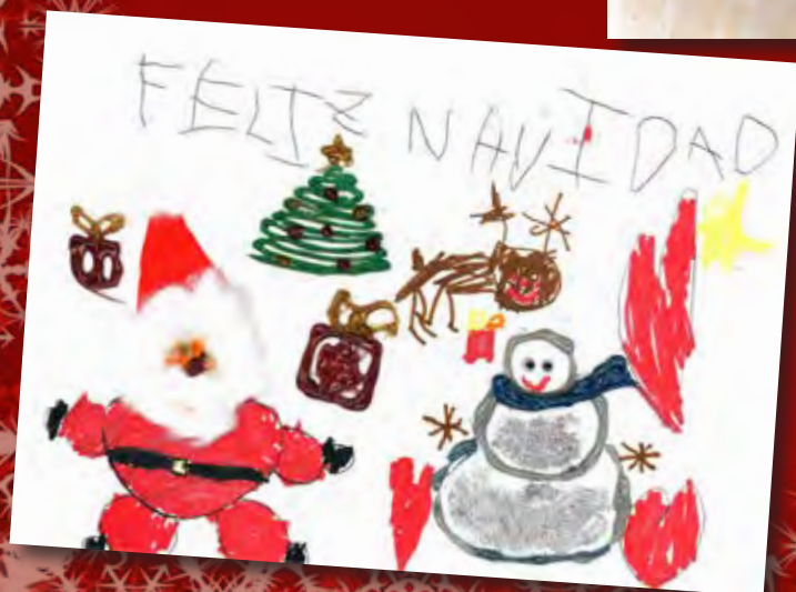
3º- Izan Cañas Pascual Categoría B